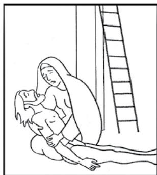
Jésus est descendu de la croix et remis à sa mère