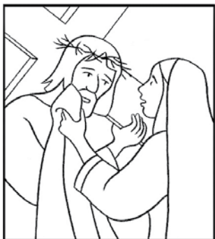
Véronique essuie le visage de Jésus