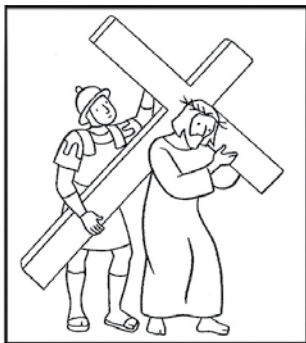
Jésus est chargé de sa croix