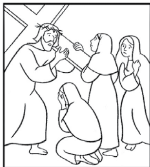
Jésus console les filles de Jérusalem