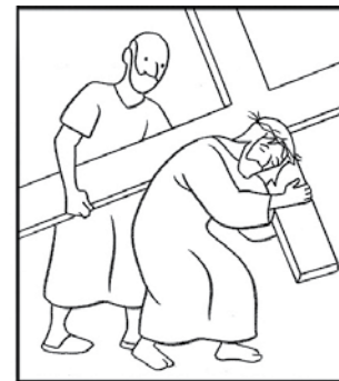
Simon de Cyrène aide Jésus à porter sa croix