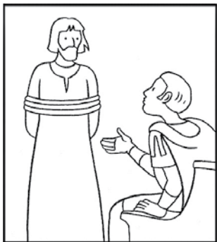
Jésus est condamné à mort