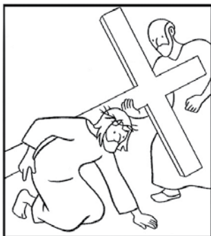
Jésus tombe pour la deuxième fois