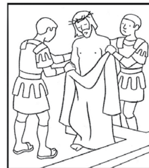
Jésus est dépouillé de ses vêtements