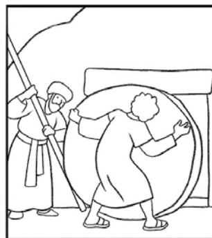
Jésus est mis dans le tombeau

Le vendredi Saint, le Christ meurt sur la croix. C'est un jour de tristesse, le plus sombre du Carême. Le Christ est arrêté et jugé. Il est chargé de sa croix, instrument de son supplice et monte au Calvaire. L'Église appelle les fidèles à jeûner selon leur âge et leurs forces, en signe de pénitence et de conversion. L'Office de la Passion propose la vénération de la Croix, et le récit de la Passion. Les fidèles peuvent assister aussi au Chemin de croix qui suit en 14 étapes la Passion du Christ.