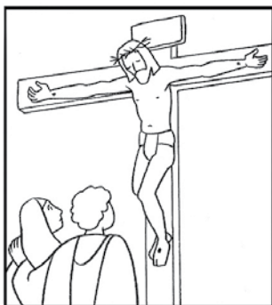
Jésus meurt sur la croix