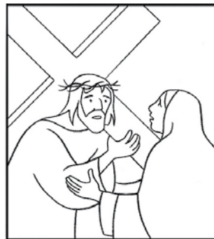
Jésus rencontre sa mère