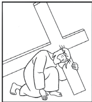
Jésus tombe pour la première fois