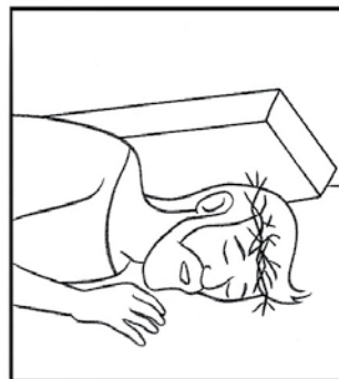
Jésus tombe pour la troisième fois